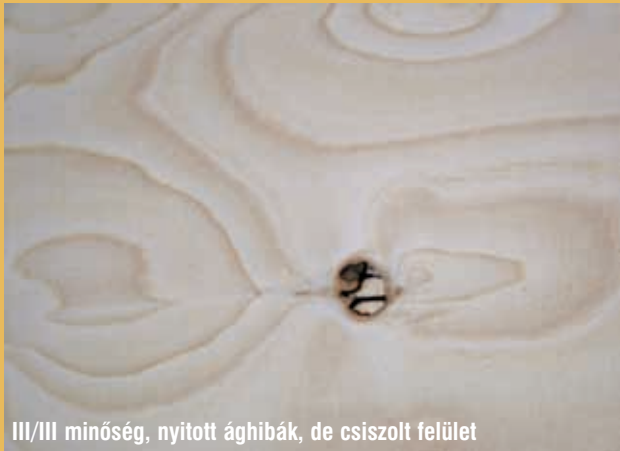
III/III minőség, nyitott ághibák, de csiszolt felület

A WISA-Spruce egy sokoldalúan felhasználható szerkezeti lemez. Saját adottságainak köszönhetően alkalmas belsőépítészeti terek, (II./III. minőség) kialakítására, igényes csomagolóanyag, kárpitváz, illetve építőipari szerkezetek elkészítésére (III./III. minőség). Az északi éghajlaton növő lucfenyőből készült furnérok sűrűsége nagyobb, mint Európa déli, illetve középső részéről származó rokonaié. A lemez felépítése zárt, felülete csiszolt, vastagsága egyenletes