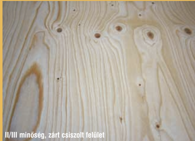
II/III minőség, zárt csiszolt felület